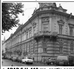
9. ARAD S.U. 118 mp, spatiu comercial, 2 spatii comerciale in centrul orasului, 118 mp si 67 mp, demisol, indicat pentru pariri sportive. Spatiul necesita amenajare pentru scopul propus; 40 L/m²/luna; 00393389432714/0722.485.8171 ancu@iol.it

1. 1 MAI, Mega Image, S.U. 100 mp, spatiu comercial, spatiu comercial, la parter de bloc, grup sanitar, utilitati; 0722.232.014/0722.316.881