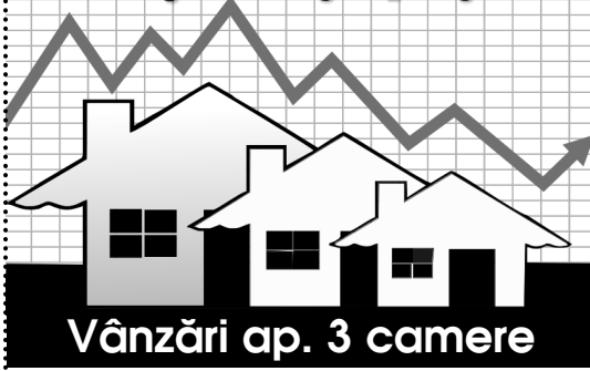
Medie realizată în baza ofertelor publicate în ziarul Anunțul Telefonic