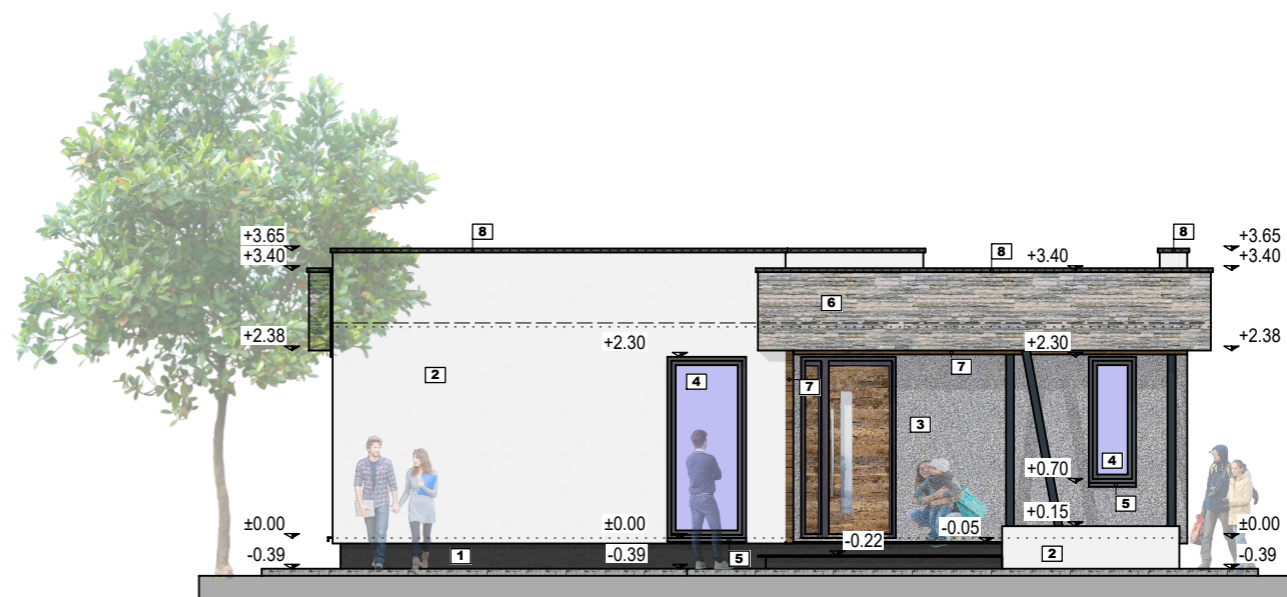
Fatada Principala - corp C2 Sc. 1:100